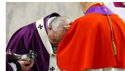
(Papež František, 28.2.2019)

Požehnání pro všechny farníky, přátele naší farnosti a dobrodince denně v 8:00, ve 12:00 a ve 20:00