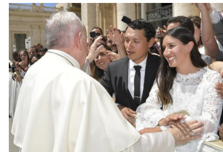
(Papež František, 19.6. 2018)

Tajemství lásky k nepřítelům bylo tématem kázání papeže Františka při ranní mši v kapli Domu sv. Marty.